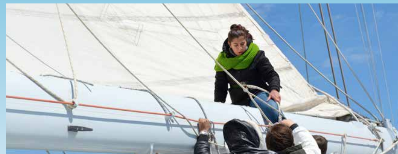
CVD - Jong ontmoet oud