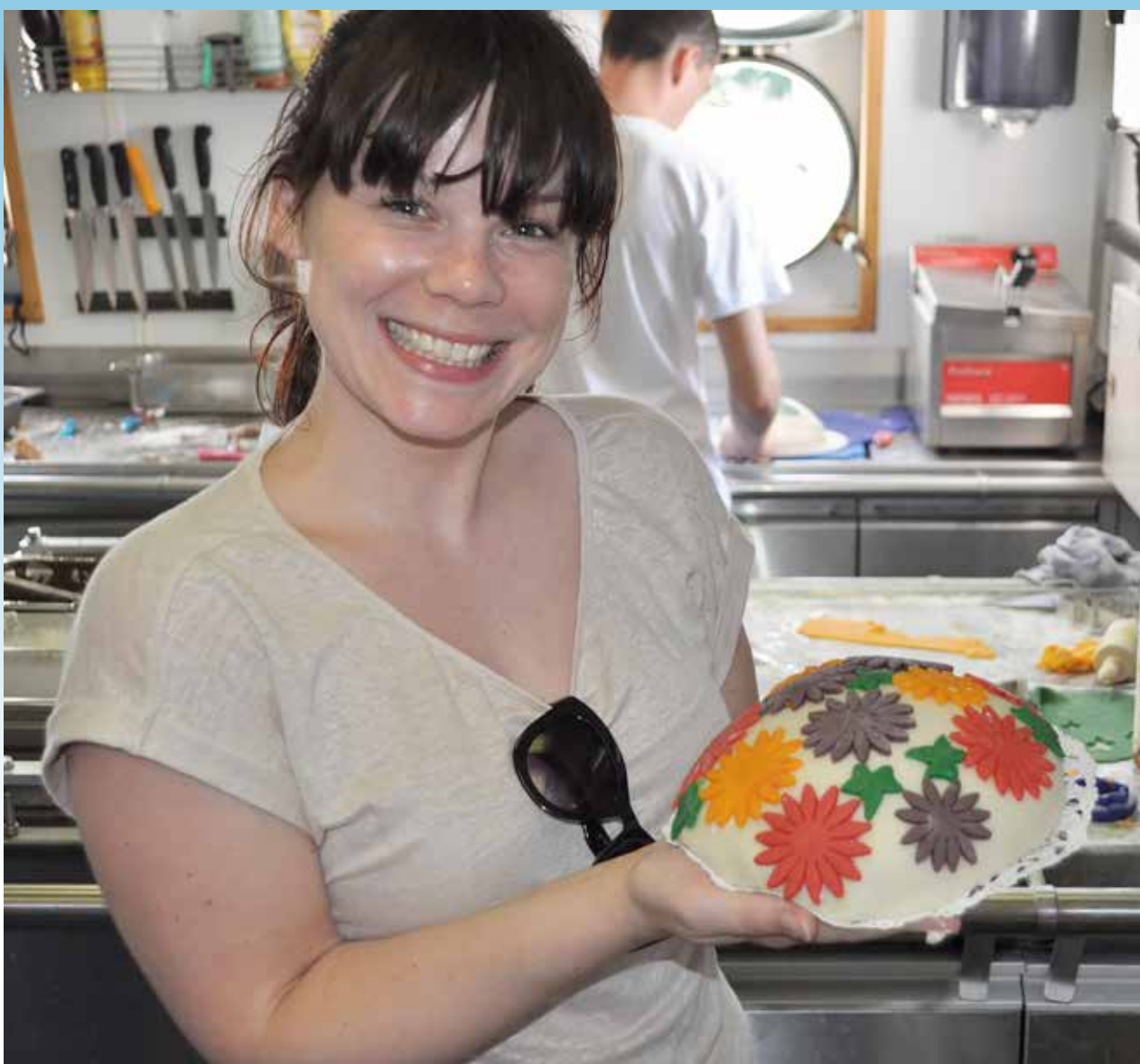
CVD - Jong ontmoet oud