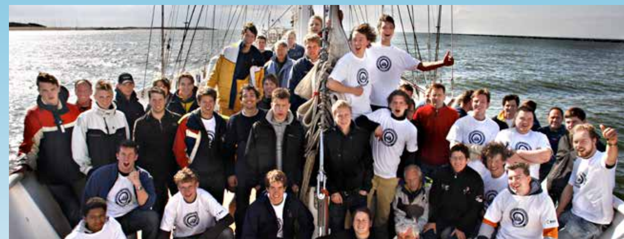
Scheepvaart en Transport College

In 2012 hebben meer dan 2000 jongeren de Eendracht bezocht!