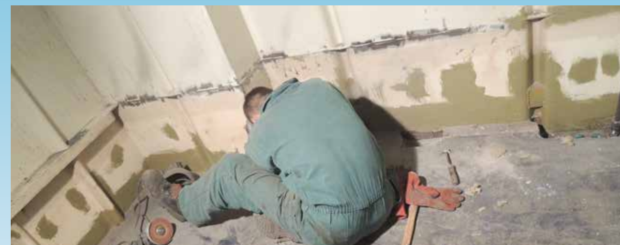
Ruimte klaarmaken voor de nieuwe koel- en vries installatie

Het groot onderhoud 2012 in de Moerdijk is goed afgerond. Mede dankzij de inzet en betrokkenheid van iedereen die meegewerkt heeft, zijn alle zaken die gepland waren voltooid en kon er hier en daar zelfs nog iets extra's gedaan worden. Wat tijdens elk onderhoud weer opvalt is dat iedereen die op welke manier dan ook betrokken is bij de Eendracht bijna fluitend zijn werk doet. Dit geldt voor de vrijwilligers maar zeker ook voor de werknemers van de diverse onderaannemers.