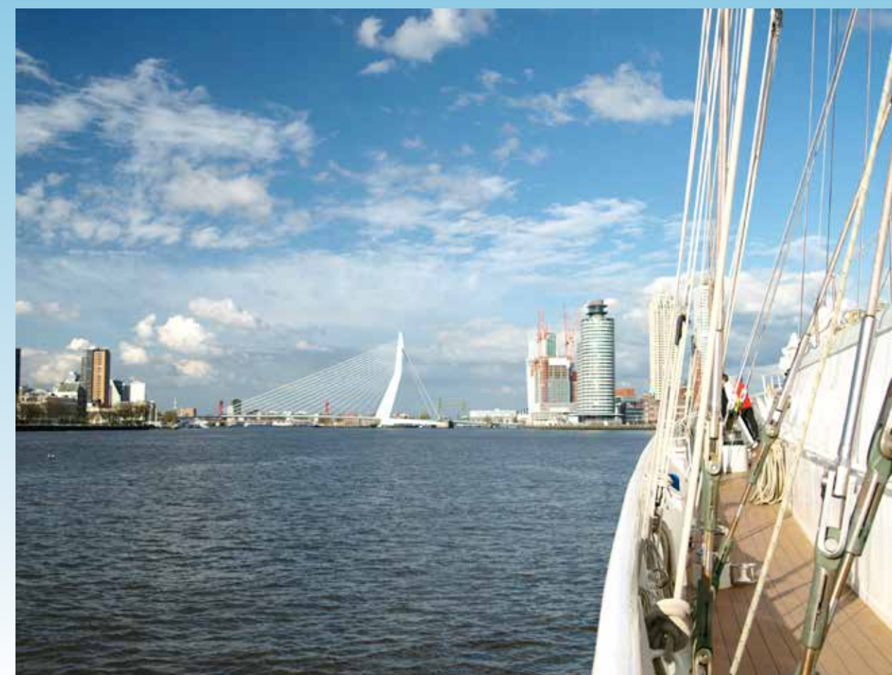
Dagtocht vanuit thuishaven Rotterdam