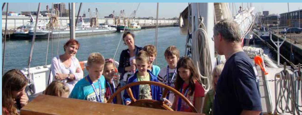
Maritime Experience Day