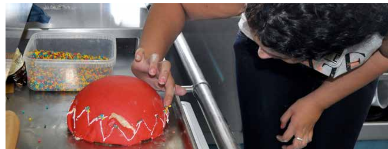
CVD - Jong ontmoet oud