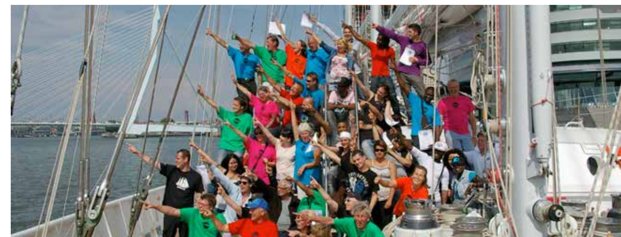
CVD - Jong ontmoet oud