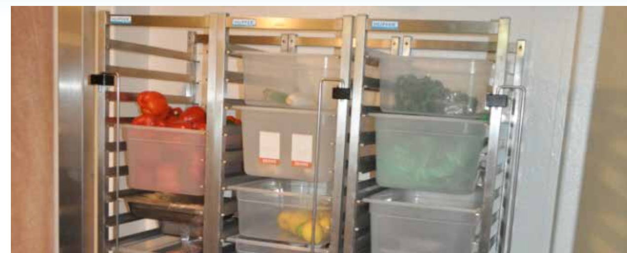
Nieuwe koel- en vriesinstallatie

Naast de koel- en vriesinstallatie zijn er nog verschillende klussen geklaard in voornamelijk de machinekamer en het kombuis. Ook zijn er gebruikelijke reeds geplande zaken uitgevoerd zoals; de boegschroefruimte is voorzien van stalen rekken voor het beter opbergen van de droge stores en bagage, veel controlewerk aan lieren aan dek en tuigage, de stuurkleppen van de winchbediening werden overhaald, zo ook de stoelen in de hutten en niet te vergeten de stoel op de brug.