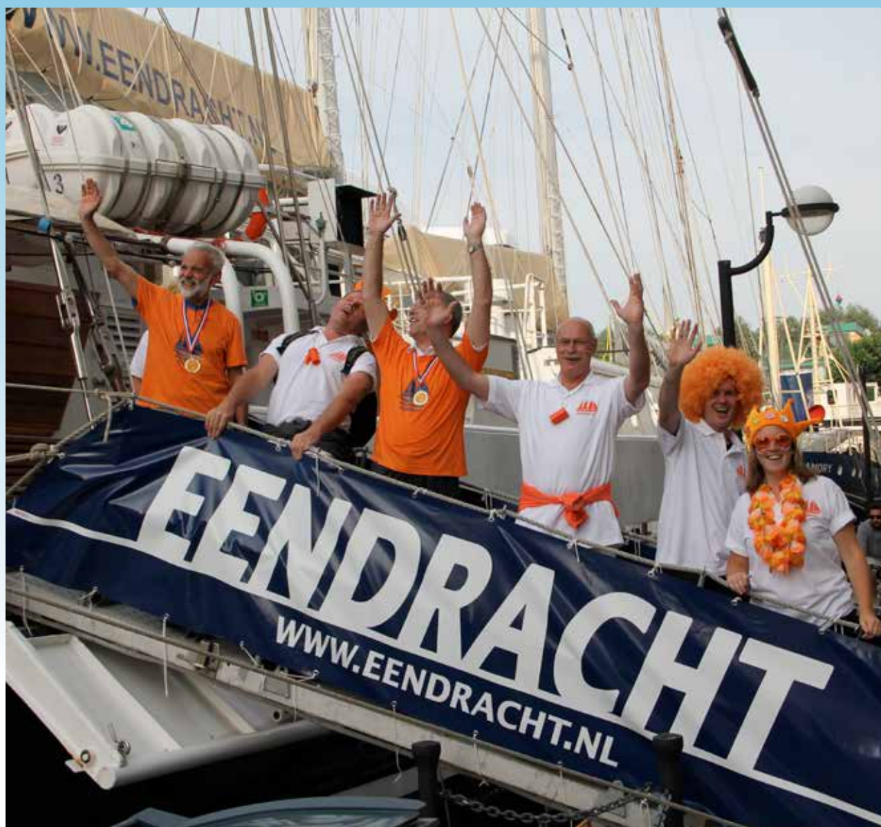
Bemanning klaar voor een avond Holland Heinekenhouse