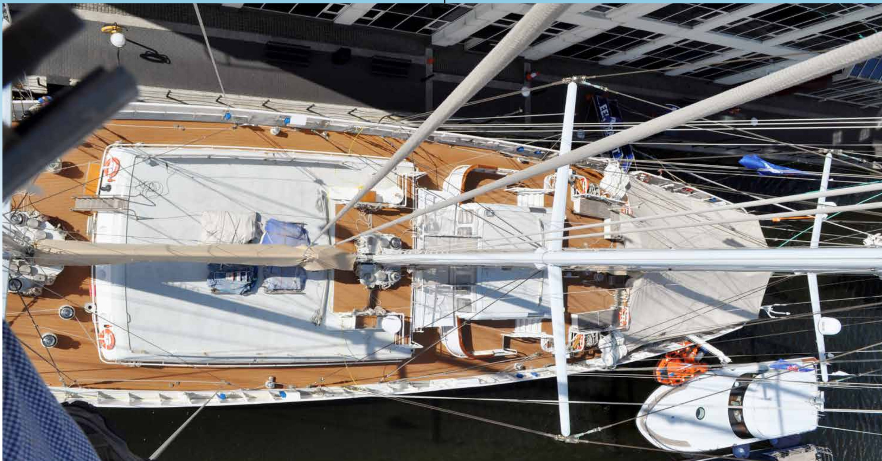
Olympische Spelen 2012